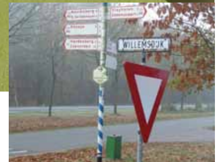
Huidige situatie Willemsdijk

wordt via de Haardijk (N 343) en het bedrijventerrein geleid. Voordeel is dat de hoofdentree en het parkeerterrein van het sportpark niet hoeven te worden aangepast en dat de leefbaarheid voor de omgeving Hessenweg verbetert. Het verkeer met bestemming campings blijft via Hardenberg rijden. De route is ondersteund met een goede bewegwijzering.