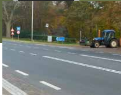
Huidige situatie Holthone