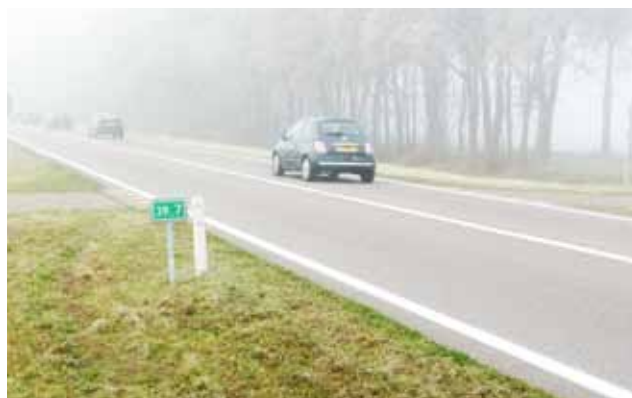
Huidige situatie Pothofweg