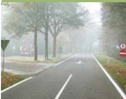
Huidige situatie De Vaart/Engbersweg