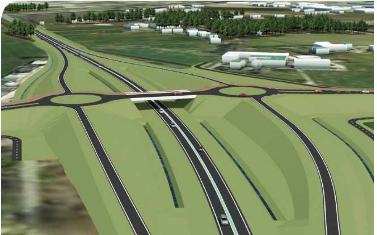
Toekomstige situatie Klooster