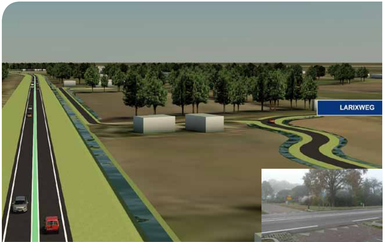
Huidige situatie Larixweg