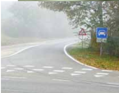
Huidige situatie De Vaart/Beltmansbrug