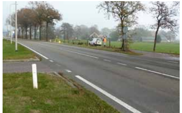
Huidige situatie Klooster