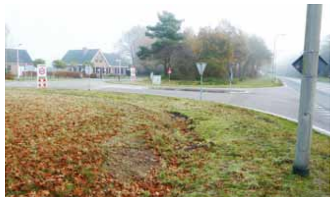
Huidige situatie Lentersdijk